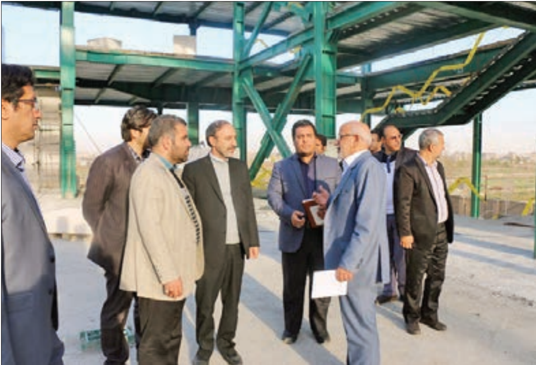
شهردار منطقه ۶ خبر داد