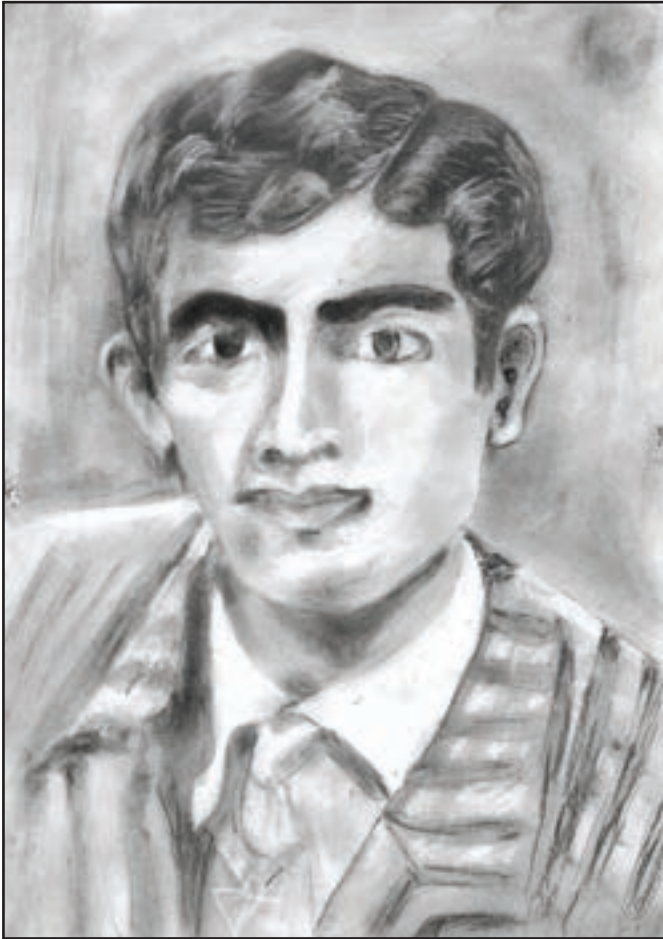
دانشجوی شهید قندچی