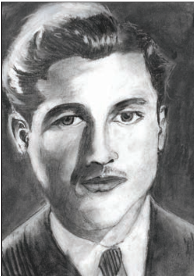
دانشجوی شهید شریعت‌رضوی

«اگر اجباری که به زنده ماندن دارم، نبود، خود را در برابر دانشگاه آتش می‌زدم؛ همان جایی که ۲۲ سال پیش، «آذر» مان در آتش بیداد سوخت، او را در پیش پای «نیکسون» قربانی کردند! این سه یار دبستانی که هنوز مدرسه را ترک نگفته‌اند، هنوز از تحصیل شان فراغت نیافته‌اند، نخواستند - همچون دیگران - کوپن نانی بگیرند و از پشت میز دانشگاه، به پشت پاچال بازار بروند و سر در آخور خویش فروبرند. از آن سال، چندین دوره آمدند و کارشان را تمام کردند و رفتند؛ اما این سه تن ماندند تا هر که را می‌آید، بیاموزند، هر که را می‌رود، سفارش کنند. آن‌ها هرگز نمی‌روند، همیشه خواهند ماند. آن‌ها «شهید»‌ند. این «سه قطره خون» بر چهره دانشگاه ما، همچنان تازه و گرم است. کاشکی می‌توانستم این سه آذراهورایی را با تن خاکستر شده‌ام بپوشانم، تا در این سموم که می‌وزد، نفس‌ند! امانه، باید زنده بمانم و این سه آتش را در سینه نگاه دارم.»