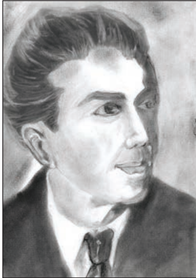
دانشجوی شهید بزرگ‌نیا