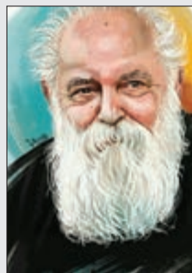
دلی که در دو جهان جز تو هیچ‌بارش نیست / گرش تو یار نباشی / جهان به کارش نیست / هوشنگ ابتهاج