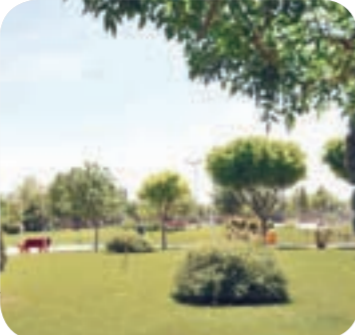
یک اتفاق خوب

اگر از ساکنان حاشیه صدمتری کم‌رندی فجر و در اراضی تلگرد بپرسید که یکی از بهترین اتفاقاتی که در ده سال اخیر توی محله شان افتاده است چیست، حتما انگشت می‌گذارند روی یک کلمه «پارک بسیج». بوسانی ۱۶۰ هزار مترمربعی که با احداث آن، چهره محلات اطراف سبز شد و مسجد، فرات خانه، زمین‌های بازی کودکان و تجهیزات ورزشی در کنار آب نماای منحصربه‌فرد آن حساسی اهالی را خوشحال کرده است. این پارک در سال ۱۳۷۸ تأسیس شده است و در فضای سبزی آن، انواع درختان از قبیل افق‌افرا، چنار، توت، اش، گردو، زیتون، سرو، کاج و گونه‌های درختچه‌ای باس و زرد دیگر گیاهان به چشم می‌خورد.