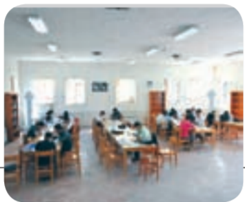
هم نشینی با یاز مهریان

اگر از ساکنان حاشیه صدمتری کم‌رندی فجر و در اراضی تلگرد بپرسید که یکی از بهترین اتفاقاتی که در ده سال اخیر توی محله شان افتاده است چیست، حتما انگشت می‌گذارند روی یک کلمه «پارک بسیج». بوسانی ۱۶۰ هزار مترمربعی که با احداث آن، چهره محلات اطراف سبز شد و مسجد، فرات خانه، زمین‌های بازی کودکان و تجهیزات ورزشی در کنار آب نماای منحصربه‌فرد آن حساسی اهالی را خوشحال کرده است. این پارک در سال ۱۳۷۸ تأسیس شده است و در فضای سبزی آن، انواع درختان از قبیل افق‌افرا، چنار، توت، اش، گردو، زیتون، سرو، کاج و گونه‌های درختچه‌ای باس و زرد دیگر گیاهان به چشم می‌خورد.