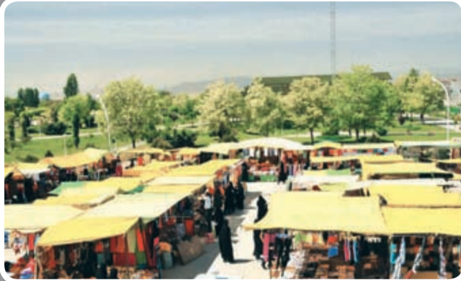
شنبه بازار تنگرد هم حساسی شلوغ است و کلی مشتری دارد