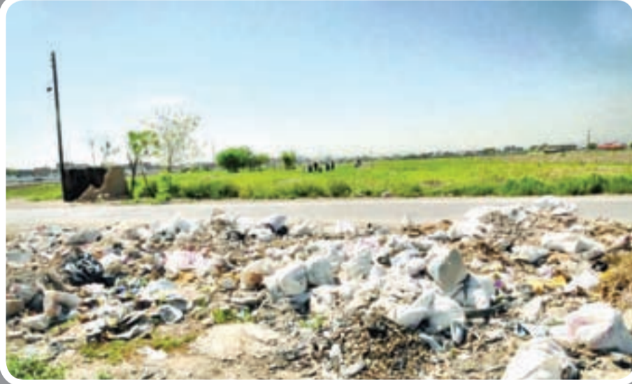
زمین‌های باغی یکی از مشکلات اهالی است