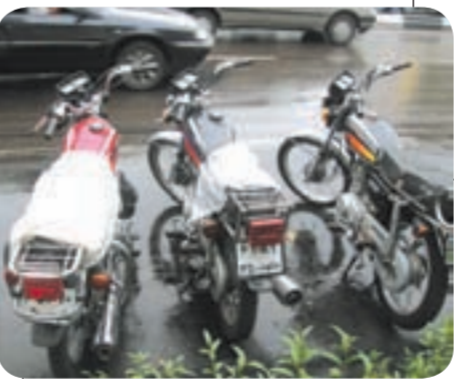
موتور سواری دولا دولا!

در این ناحیه و در سطح سه محله آن سه جایگاه سی‌ان‌جی قرار دارد که دوتایی آن به صورت دولتی و خصوصی فعال بوده و یکی هم در حال ساخت است.