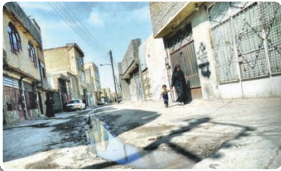
اشتیابات غیر مجاز فاضلاب چهره کوچ‌های این محلات از زشت کرده است