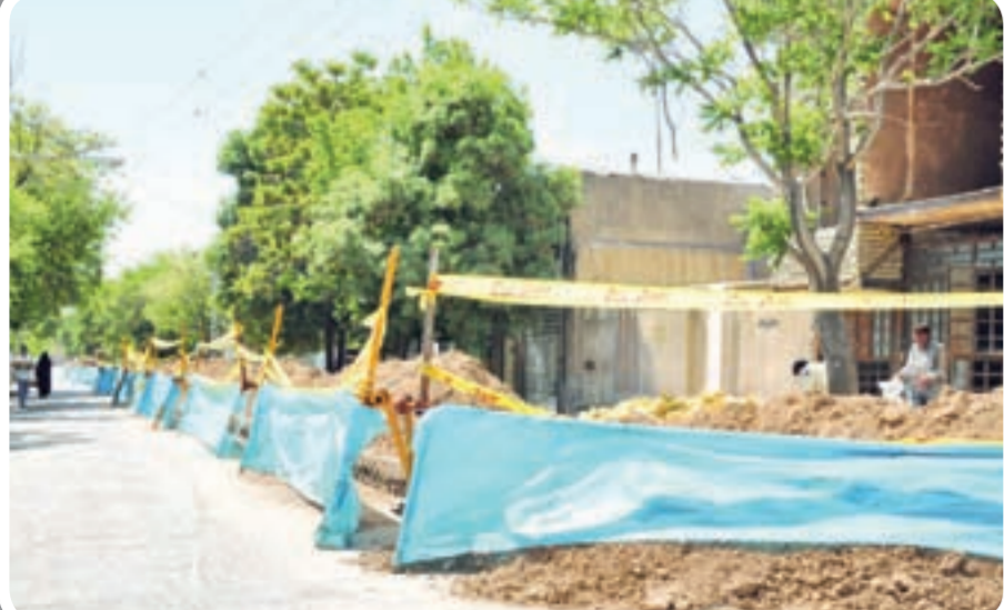
تصویری از اجرای طرح فاضلاب در این محلات