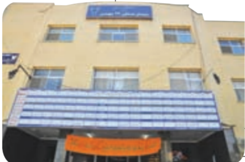
توی راه روی سفید

اسم بیمارستان که می‌آید حتما خیلی از ما و شما یاد راهروهای سفیدی می‌افتیم که معلوم نیست تهران به کدام اتاق می‌رسد. بگذریم در قلب ناحیه دو منطقه ۴ یک بیمارستان بزرگ قرار دارد که ۱۰۷ تختخواب آن منطبق به دانشگاه آزاد اسلامی است. کمی دورتر و در همان راسته هم دارالشفا امام جواد(ع) قرار دارد که به اهالی این سه محله و محلات دیگر مشهد خدمت‌رسانی می‌کند.