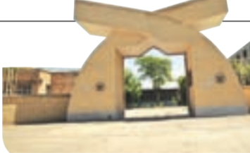
برای لحظه‌های بحرانی

پژوهش سرا و ازمایشگاه مرکزی ایور بچان، همسایه اهالی تلگرد است. این مرکز پژوهشی که مختلط آن، دانش آموزان مقاطع مختلف است، زیر نظر آموزش و پرورش اقدامات علمی تحقیقاتی انجام می‌دهد.