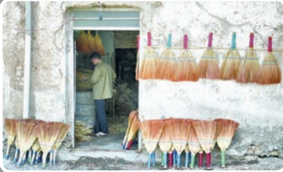
حصیر و جاروبانی یکی از مشاغل مهم محله تنگرد است